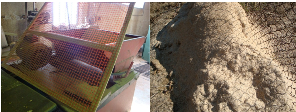
شکل ۱- خاکاره‌های جمع‌آوری شده