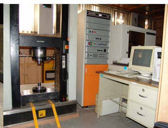
شکل ۵- دستگاه آزمایشگر مقاومت مکانیکی