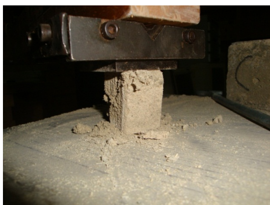
شکل ۶- نمونه فشاری در حال آزمایش