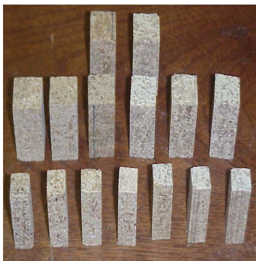
شکل ۲- الک برقی خودکار سایزبندی