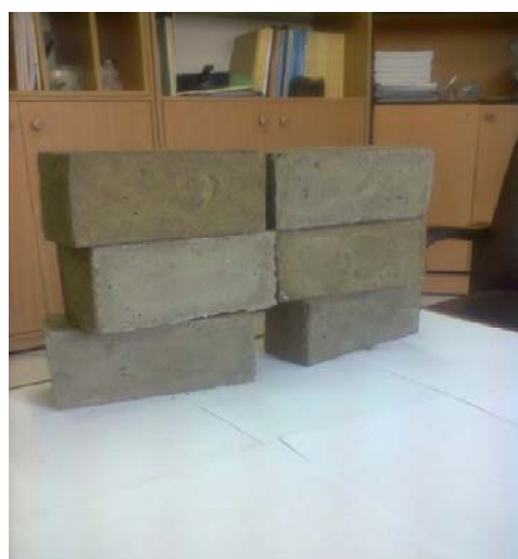
شکل ۳- نمونه‌های چوب سیمان ساخته شده