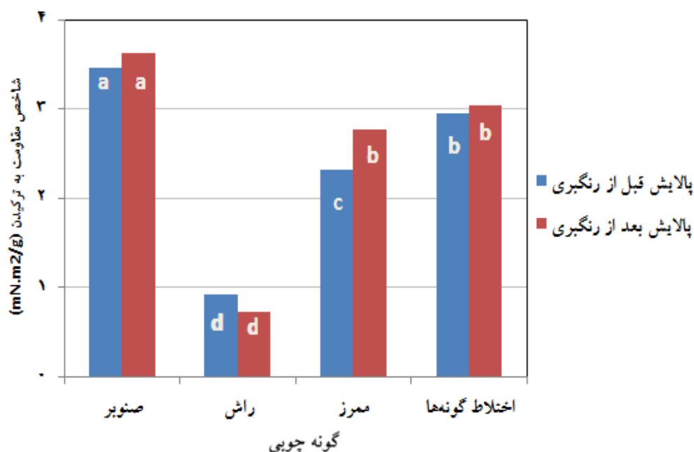
شکل ۳- اثر گونه چوبی بر شاخص ترکیدن خمیر کاغذ شیمیایی-مکانیکی پالایش شده قبل و بعد از رنگبری