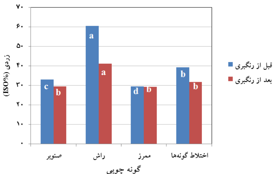
شکل ۷- اثر گونه چوبی بر زردی خمیرکاغذ شیمیایی- مکانیکی پالایش شده قبل و بعد از رنگ‌بری (BR)

خالص صنوبر و ممرز و نیز خمیرکاغذ مخلوط گونه‌ها به هم نزدیک شده، به طوری که اختلاف معنی‌داری بین آنها وجود ندارد و طبق گروه‌بندی دانکن در گروه مستقل a قرار می‌گیرند. این موضوع پاسخ متفاوت این خمیرها را به رنگ‌بری با پراکسید هیدروژن با وجود اختلاف آماری بین