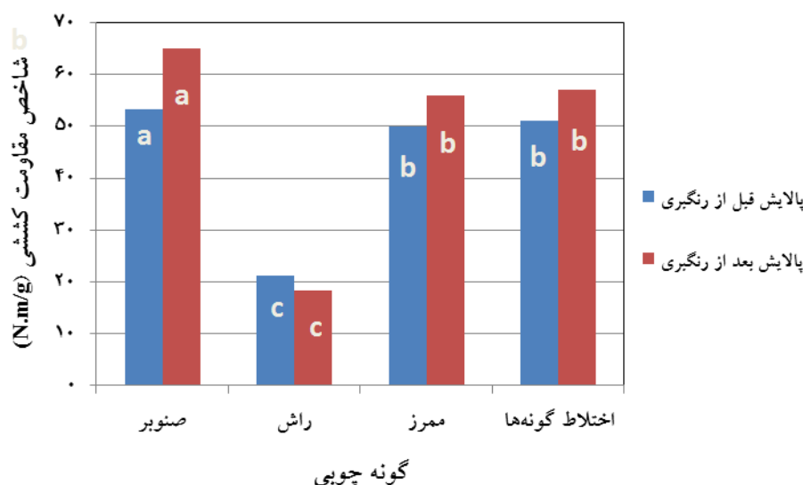
شکل ۲- اثر گونه چوبی بر شاخص مقاومت کششی خمیرکاغذ شیمیایی- مکانیکی پالایش شده قبل و بعد از رنگ‌بری

بیشتر بودن مقاومت کششی این گونه نسبت به دو گونه چوبی دیگر است. افزایش فیبریلایسیون داخلی به دلیل جدا شدن فیبریل‌های سلولزی و لیگنین‌زدایی بهتر در مرحله رنگ‌بری که منجر به تورم بیشتر دیواره سلولی و به تبع آن افزایش سطح اتصالات بین لیفی در خمیرکاغذ RB صنوبر می‌شود را