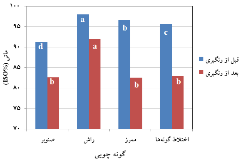
شکل ۶- اثر گونه چوبی بر ماتی خمیر کاغذ شیمیایی - مکانیکی پالایش شده قبل و بعد از رنگ‌بری (BR)

ممرز دارای کمترین مقدار است و اختلاف معنی‌داری در سطح اطمینان ۹۹ درصد بین میانگین زردی خمیرهای کاغذ وجود دارد. پس از رنگ‌بری، میانگین زردی خمیر کاغذ