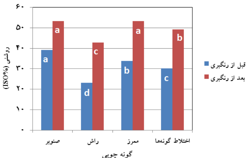
شکل ۵- اثر گونه چوبی بر روشنی خمیر کاغذ شیمیایی - مکانیکی پالایش شده قبل و بعد از رنگ‌بری (BR)

صنوبر از ضریب انطاف‌پذیری و درصد سلولز زیاد و لیگنین کمی برخوردار بوده که این امر قابلیت الیاف این گونه را برای افزایش سطح پیوند و کاهش تفرق نور افزایش داده، در نتیجه ماتی کاهش پیدا می‌کند. با کاهش طول و افزایش سطح ویژه الیاف، میزان ماتی کاغذ در نتیجه افزایش درصد