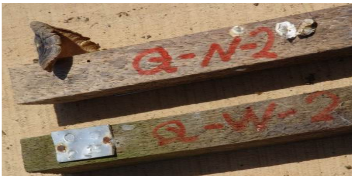
شکل ۲- رشد قارچ رنگین کمان در نمونه اشباع نشده (بالا) پس از ۱۴ ماه و عدم تخریب نمونه اشباع شده (پایین) پس از ۵۱ ماه استقرار در خاک در ایستگاه شلمان