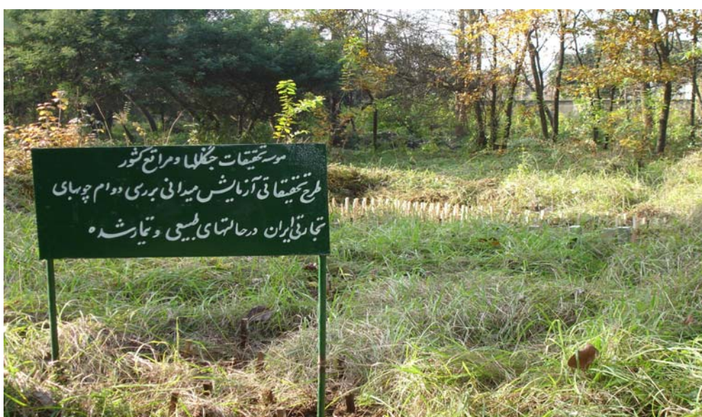
شکل ۱- نصب نمونه‌های آزمونی در ایستگاه شلمان

استقرار نمونه‌ها در خاک: نمونه‌های آزمونی به صورت عمودی در خاک نصب شدند. در روش نصب عمودی، به‌طور تقریبی نصف نمونه در بیرون از خاک قرار می‌گیرد و در مواقعی که رطوبت خاک مناسب باشد، ارزیابی نمونه‌ها نیاز به تخریب خاک کمتری دارد. در استان مازندران، اولین نمونه‌های آزمونی در ایستگاه چمستان در قسمت جنوب ایستگاه و در زمین با شیب