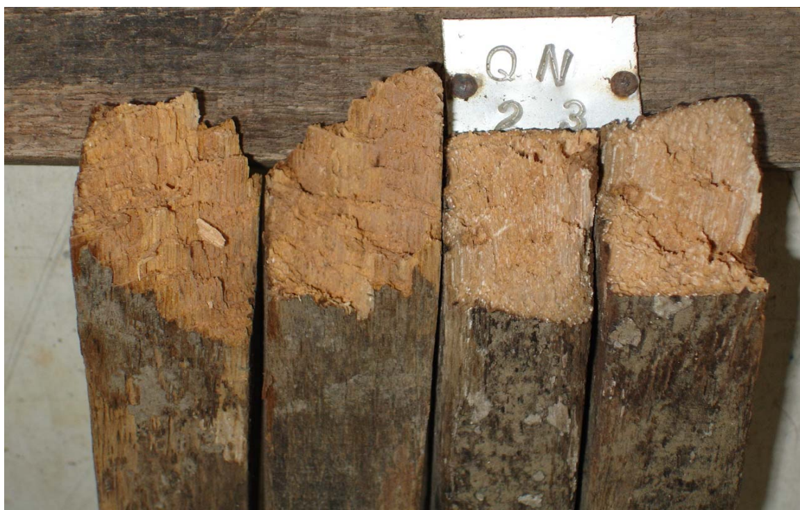
شکل ۳- پوسیدگی شدید در نمونه‌های دوام طبیعی بلندمازو پس از ۳۲ ماه استقرار در خاک در ایستگاه شلمان

SR)، که در اینجا گویای افت مقاومت مکانیکی می‌باشد، نیز اندازه‌گیری شد. این نسبت حاصل تقسیم میانگین