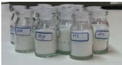
شکل ۲- نمونه‌های هولوسلولز از اکوتیپ‌های مختلف استبرق