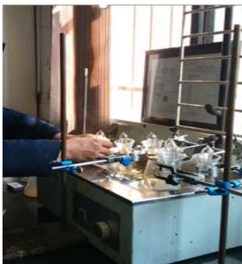
شکل ۱- نمایی از واکنش تهیه هولوسلولز