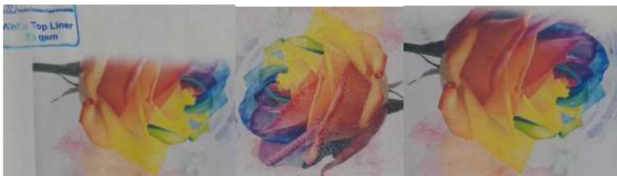
شکل ۳- بهترین نمونه‌های کیفیت چاپ تصویر بر روی کاغذهای وایت تاپ راشا (سمت راست)، سفید پارس (در وسط) و منسوج نبافته

برای دستیابی به کیفیت چاپ مطلوب، باید برهم‌کنش بین جوهر چاپ و سطح کاغذ و نفوذ جوهر به لایه پوشش در نظر گرفته شود. برهم‌کنش بین کاغذ و جوهر به محض تماس آغاز می‌شود و فرایند جذب پس از اولین تماس، پایداری