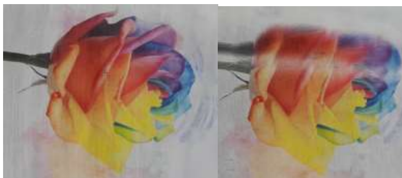
شکل ۲- بهترین نمونه‌های کیفیت چاپ تصویر بر روی کاغذهای سوپرکرافت راشا (سمت راست) و کرافت تبریز اندودشده (سمت چپ) Figure2- The Best Quality Printing Samples on the Rasha Super kraft (on the right) and Tabriz Kraft Coated papers (on the left)

در بین تصاویر چاپ شده نمونه‌های کاغذ سوپرکرافت راشا (تیمار D) و کرافت تبریز (تیمار J) کیفیت عالی و خیلی خوب چاپ را ارائه داده‌اند (شکل ۲).