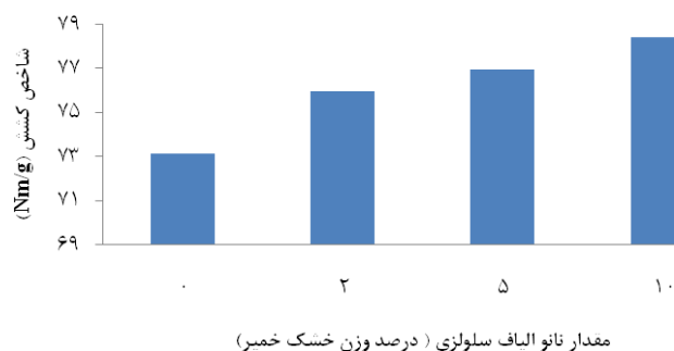
شکل ۱- اثر نانو الیاف سلولزی بر شاخص مقاومت کششی خمیر کاغذ پالایش شده و نشده